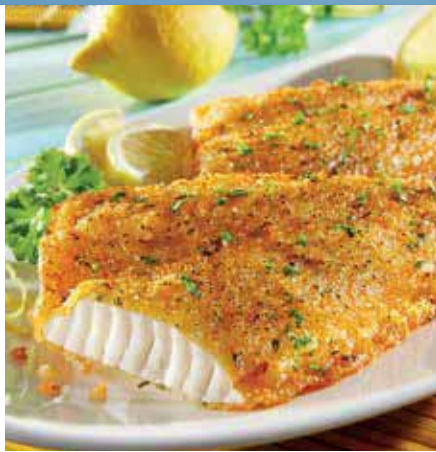
Portionsfilet in Zitronen-Kräuter Panade mehliert und vorgebraten, 30 x 160 g Stück

sewe Frost Tiefkühlspezialitäten aus aller Welt