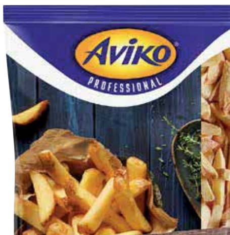
10 mm, mit Schale, 4 x 2,5 kg Beutel