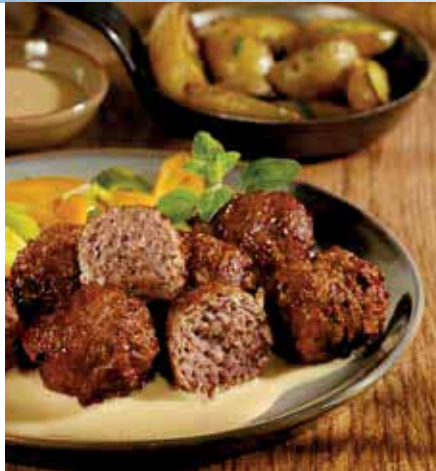
gegart & gebräunt, ca. 30 g Stück, 7,5 kg im Karton