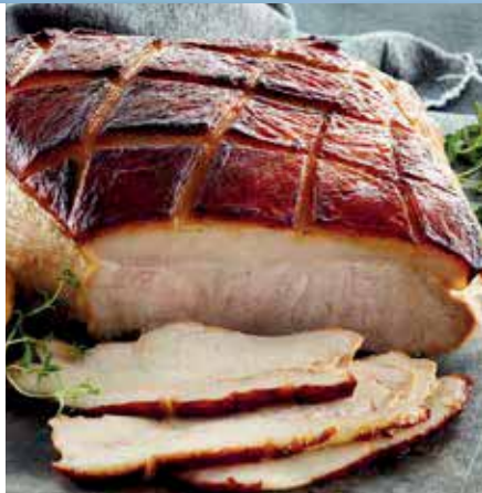
Kombidämpfer geeignet, Rôte de jambon au miel, moutarde et jus d'orange, Stück/pièce ca. 2,35 kg